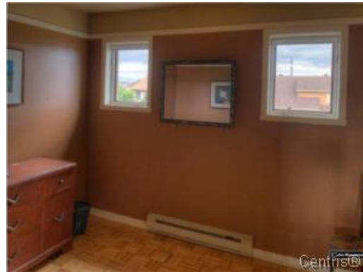
Bureau à domicile