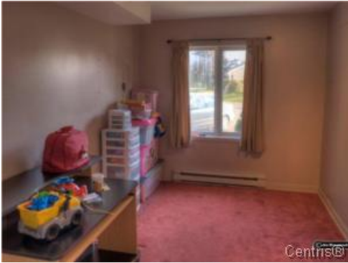
Bureau à domicile