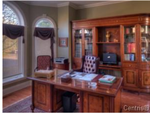
Bureau à domicile