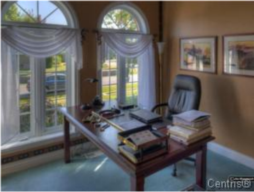
Bureau à domicile