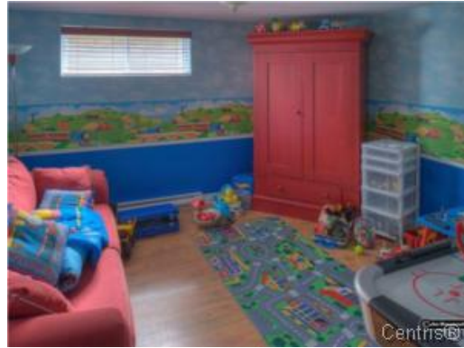
Bureau à domicile