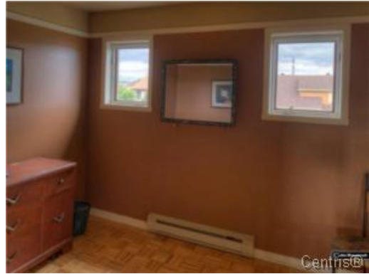
Bureau à domicile